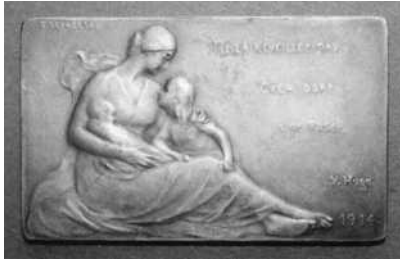
oorspronkelijke medaille ter vergelijking