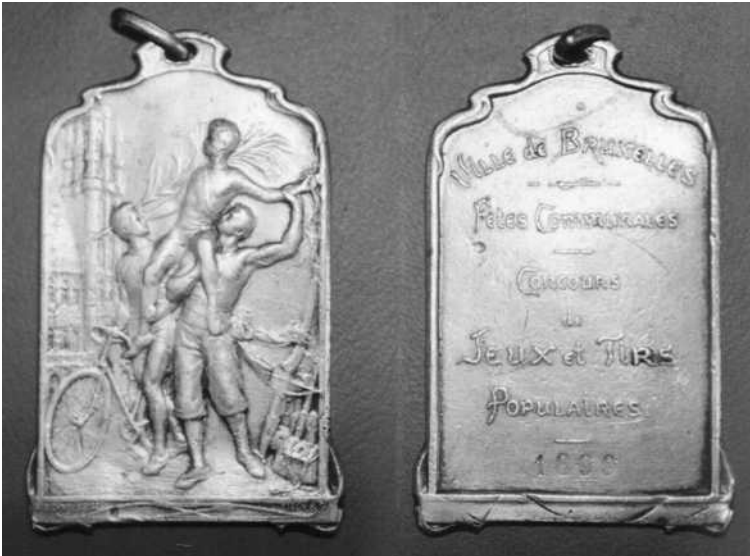
oorspronkelijke medaille ter vergelijking